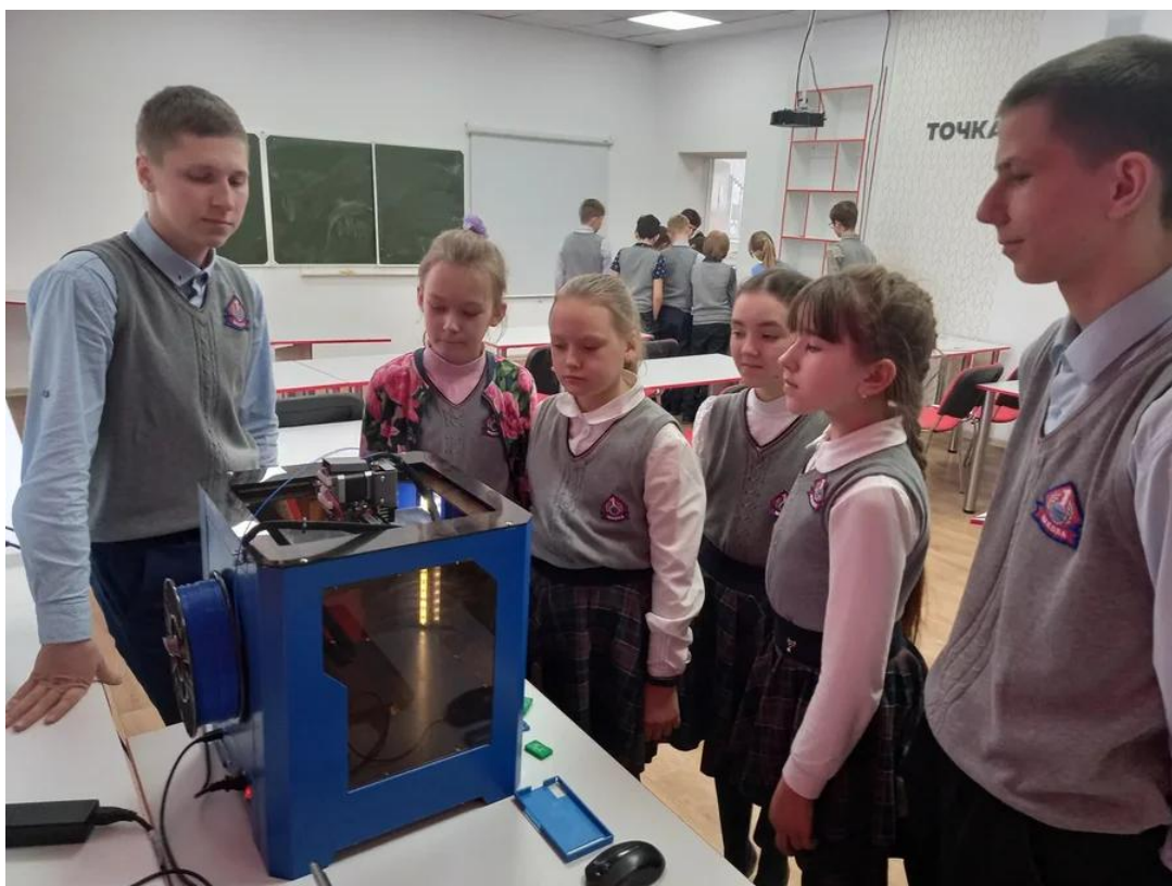
Работа 3 D принтера

Также, в течение недели, проходили мастер-классы для ребят специализированных классов.