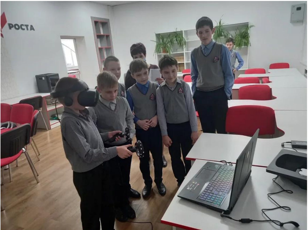
Шлем виртуальной реальности