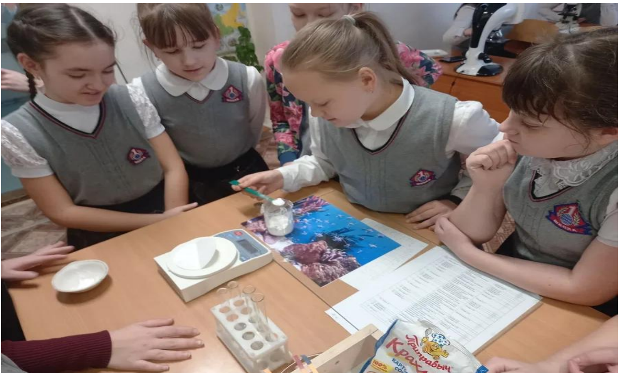
Работа химической лаборатории