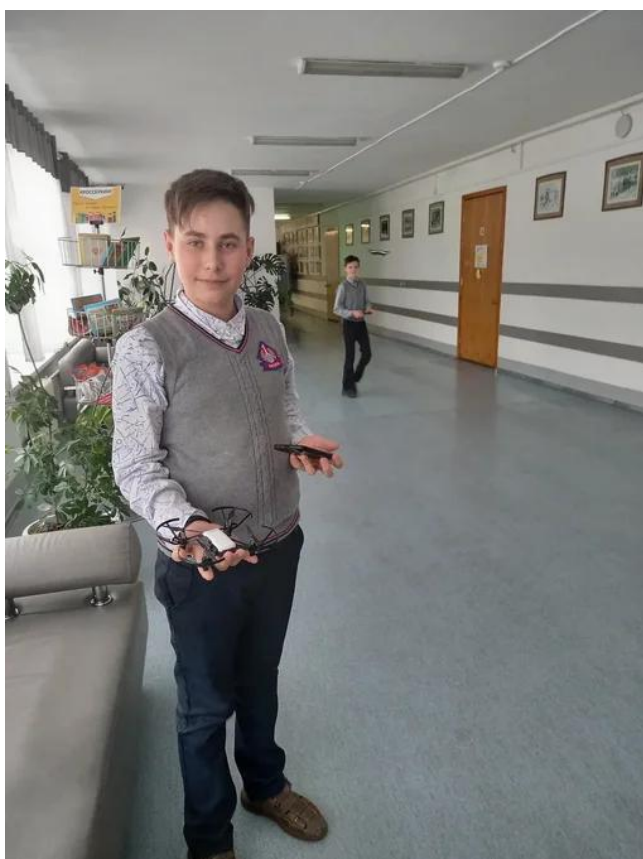
Беспилотные летательные аппараты