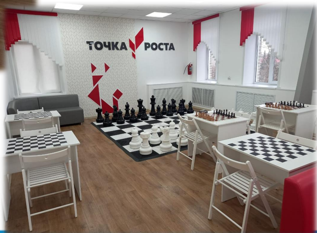
Центр цифрового гуманитарного направления «Точка роста»